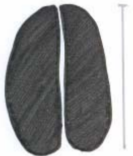
Huella de ciervo.

El tamaño de la cuerna depende de múltiples factores, la edad, la alimentación, la salud, etc..., desarrollándose cada año en mayor o menor medida.