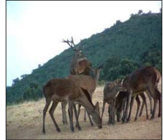
Macho con su harén.

Con las primeras lluvias de septiembre se comienzan a escuchar los berridos de los machos, es un sonido profundo y largo, parecido a un mugido de vaca. Durante un mes los machos no dejarán de emitir fuertes berridos o bramidos. Con este gesto anunciará la llegada del celo y avisará de su presencia a las hembras y al resto de los machos.